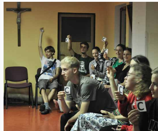
Chcete být milionářem? Názor publika.

V rámci večerních programů jsme si zahráli Chcete být milionářem?, probrali různá témata a předvedli své talenty na závěrečném večeru.