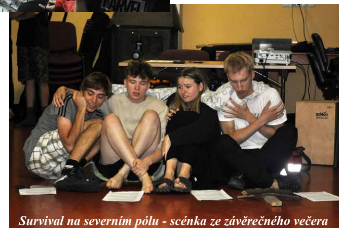
Survival na severním pólu - scénka ze závěrečného večera