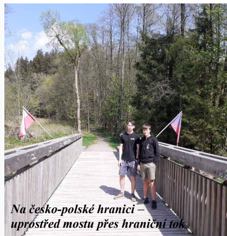
Na česko-polské hranici – uprostřed mostu přes hraniční tok