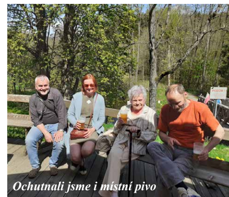
Ochutnali jsme i místní pivo