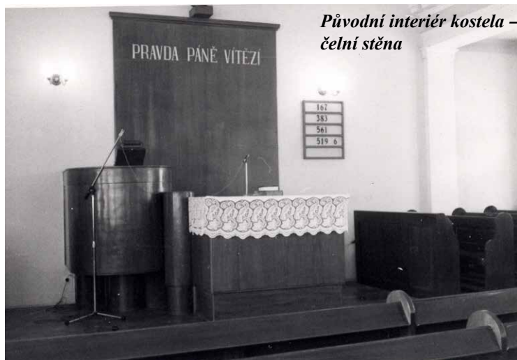
Původní interiér kostela – čelní stěna

Připravovaná výstava v Muzeu umění se stává impulzem pro připomenutí doby, ve které toto umělecké dílo vznikalo. Požádali jsme proto pana doc. Pavla Herynka o rozhovor, ve kterém rád na položené otázky Janu Bartuškoví pro náš měsíčník POSEL odpovídal: