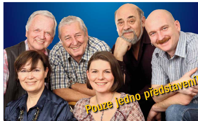
Spirituál Kvintet na plakátě z r. 2011

Spirituál Kvintet po 60ti letech hraní končí. V Lucerně odehrává posledních 16 koncertů.