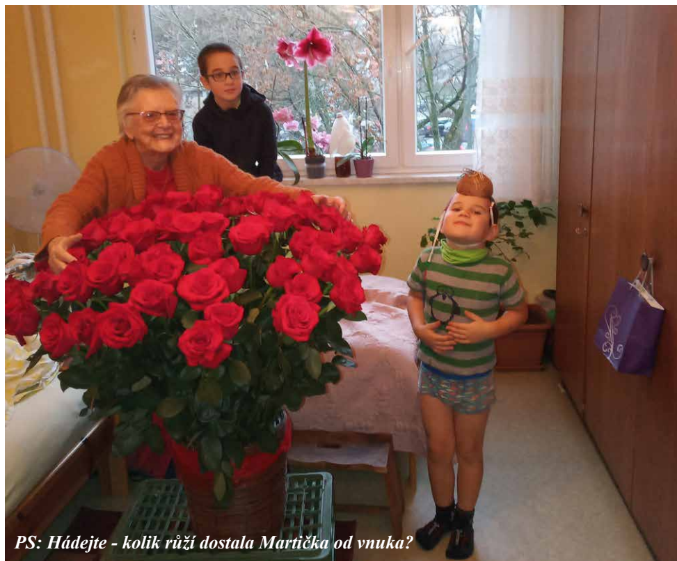
PS: Hádejte - kolik růží dostala Martička od vnuka?