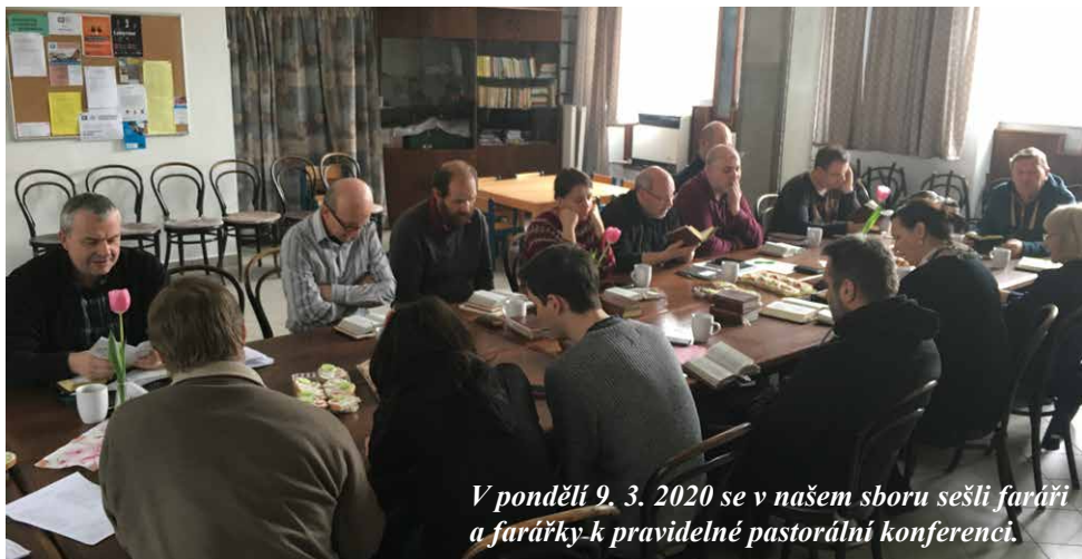
V pondělí 9. 3. 2020 se v našem sboru sešli faráři a farářky-k pravidelné pastorální konferenci.