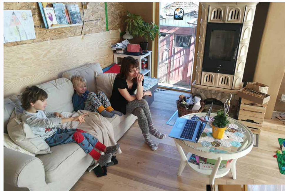
Neděle 15. 3. 2020 v rodině – přímý přenos bohoslužeb a potom také káva a čaj.