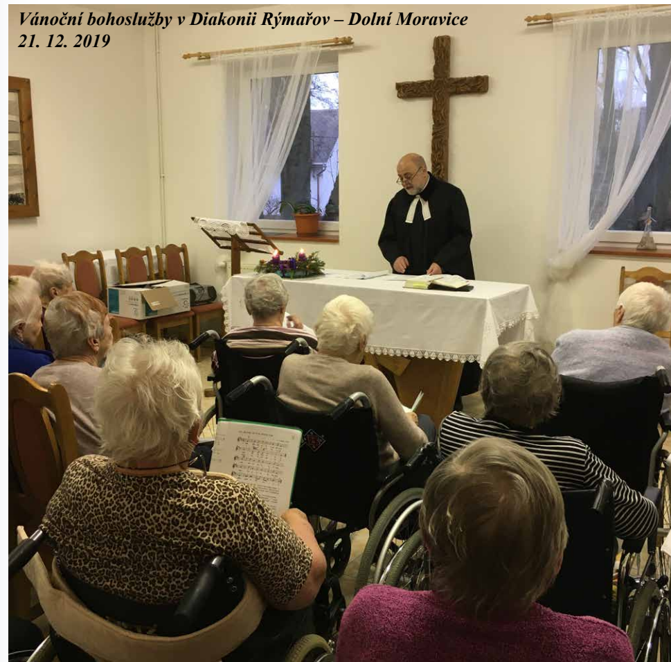
Vánoční bohoslužby v Diakonii Rýmařov – Dolní Moravice 21. 12. 2019