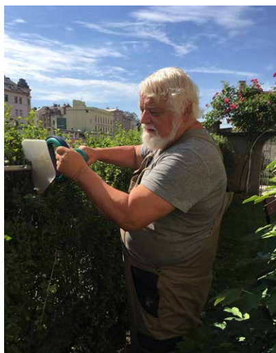
Děkujeme všem, kteří pomohli při velkém úklidu našeho kostela!