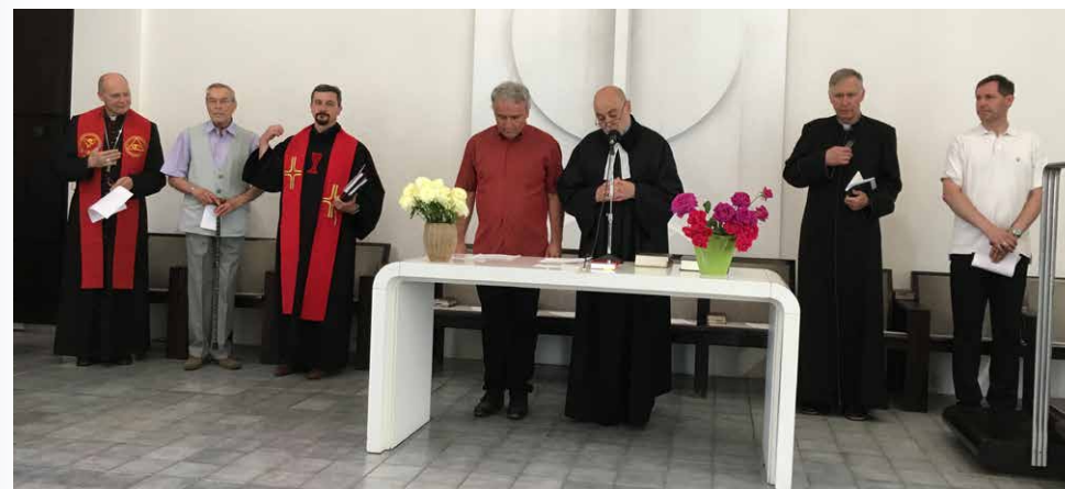
Ze svatodušní ekumenické bohoslužby u nás 10. 6. 2019