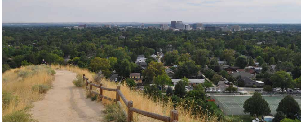
Pohled na (zavlažované) Boise z (nezavlažovaných) pahorků. To dole není park, ale celé město s domy schovanými pod korunami stromů!

Už ten kostel – tvoří jej rozlehlá přízemní budova s mnoha víceúčelovými prostorami. Kromě hlavního sálu, kde se konají boho-