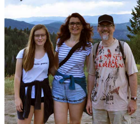
Na výletě v horách asi 15 mil od Boise

a radami nám opravdu velmi usnadnili začátky v nové zemi.