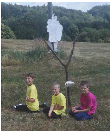
Celý týden nás provázel příběh o Davi- dovi. Vypořádat jsme se museli i s pří- chodem obra Goliáše. Na závěr byl „slavnostně“ oloupen. Veselme se...