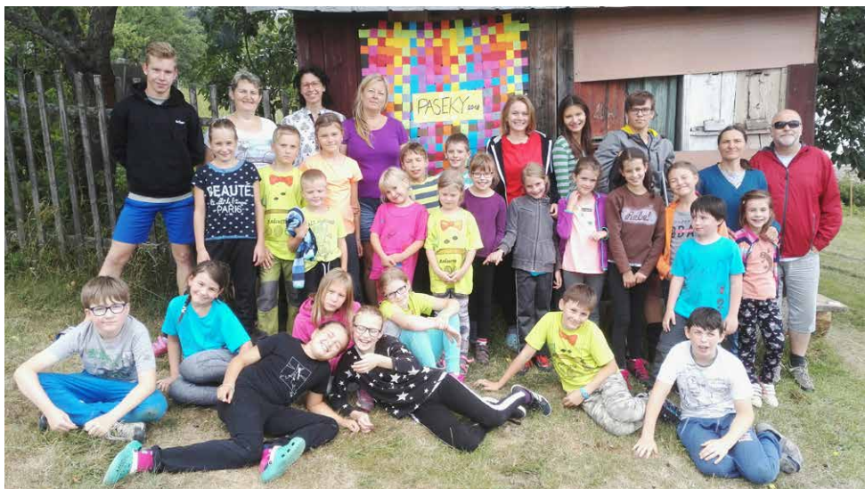
Letošní tábor na Pasekách uvítal 23 mladých účastníků. Poznáte, kdo byl s námi?