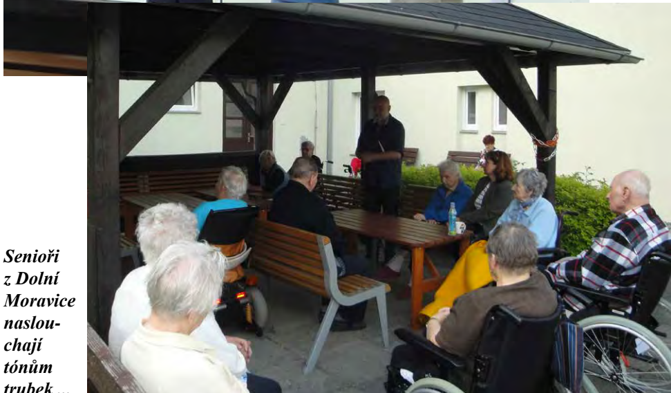
Senioři z Dolní Moravice naslou- chají tónům trubek ...