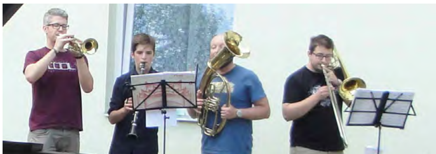
Trubači Consonare vyhrávají před pří- střeškem