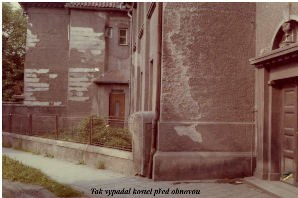
Tak vypadal kostel před obnovou

Zvlášť je třeba připomenout bratra Vlastimila Růžičku, který se zavázal, že celou věž otluče a vyčistí sám. Vzal si opravdu