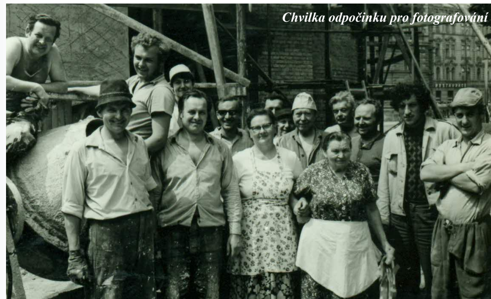
Chvilka odpočinku pro fotografování