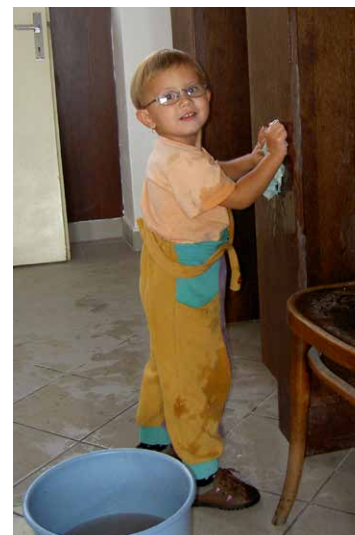
Přiložit ruku k dílu se učíme od malička.