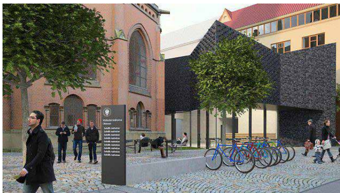
Studie stavebních úprav Červeného kostela na třídě Svobody v Olomouci.

Nejprve bude dominantu třídy Svobody potřeba opravit. Poslední větší investice šla koncem 80. let do střechy. „Pokud by akce dostala zelenou, podstatou toho všeho bude rekonstrukce historické budovy včetně statického zajištění a sanace proti vlhkosti, protože v lokalitě je poměrně vysoká hladina spodní vody,“ nastínil Miroslav Pospíšil z olomouckého atelier-r. Nechávat ale památku prázdnou by nemělo smysl. Kraj proto mimo jiné chce, aby sloužila ke kulturním účelům. Prostor pro dvě stě až dvě stě padesát lidí lze využít například pro koncerty vážné hudby, čtení nebo výstavy.