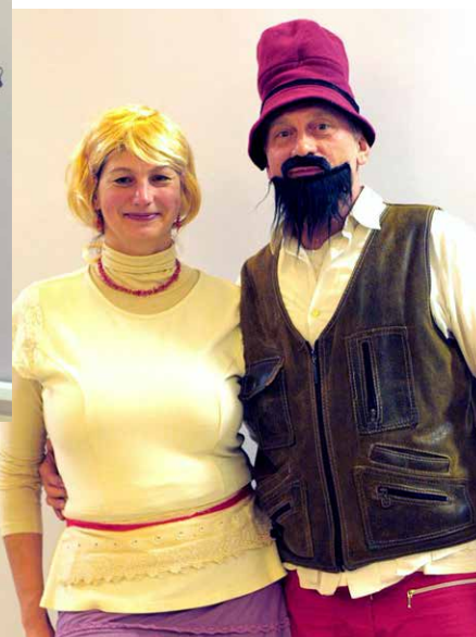
Kdo by nepoznal známé postavy z Večerníčků i lidových pohádek, Karkulky, Vlky, Rumcajse s Mankou a další ...