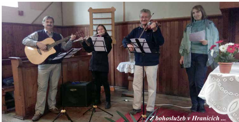
Z bohoslužeb v Hranicích ...