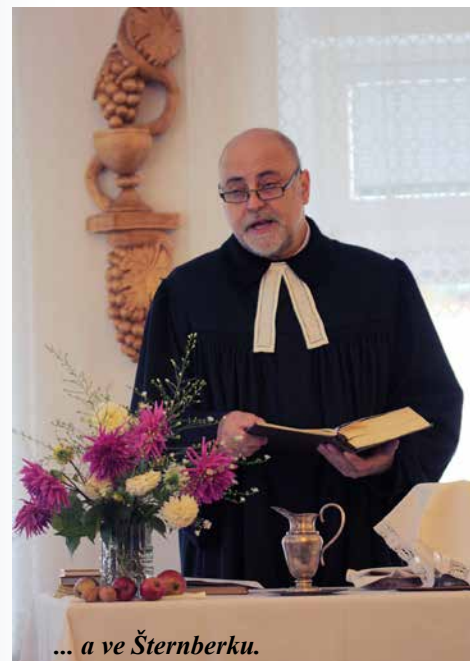
... a ve Šternberku.

„Pomáhej, Duchu lásky, odpouštět a jít vstříc, pomáhej, Duchu pravdy, poznávat stále víc, že je Kristus jeden, nerozdělen, že je hlavou církve a my tělem.“ (Píseň 678)