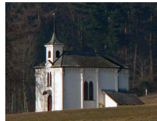
Modlitebna ve Svěbohově