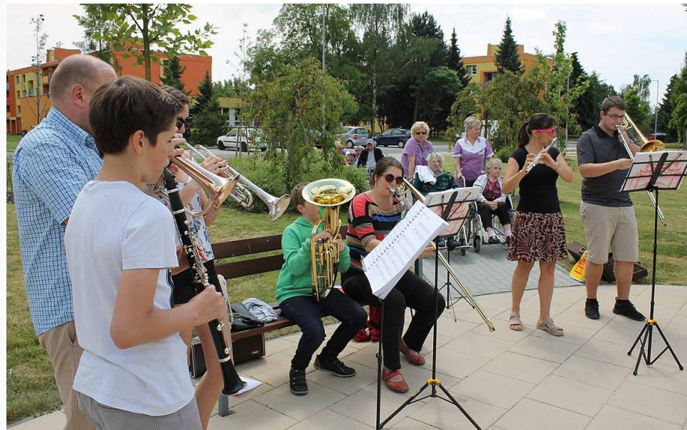
Ještě aspoň fotkou si připomeňme neděli 20. 6. v DD ve Chválkovicích