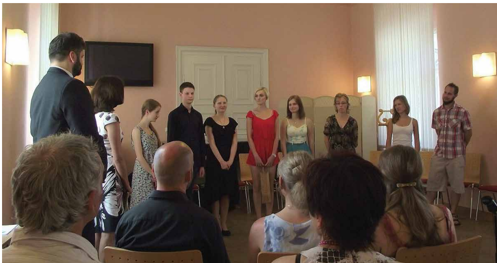
Závěrečné bohoslužby na KEA

Ve středu 1. června 2016 se nám opět představili studenti Konzervatoře EA při Dobrém večeru s hudbou. Měli jsme radost, že v rámci jejich vystoupení zazněly i písně komunity Taizé, které studenti nacvičili pro mezinárodní setkání křesťanů v Budapešti, které se koná ve dnech 7. až 10. července 2016.