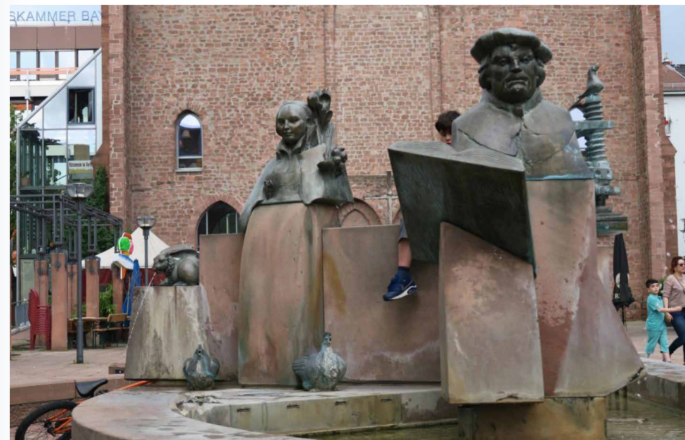
Pomník Martina Luthera a jeho ženy v srdci Ludwigshafenu