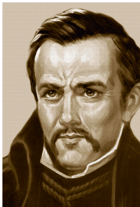
Mučedník Jan Ogilvie, * 1579, +10. března 1615

řil do svých 25 let, až dospěl k poznání, že naše srdce bude tak dlouho neklidné, dokud nespočine v Tobě, Bože. Našla jsem zajímavé čtení „Mučedník reformovaný na Moravě“. Skotský světec Jan Ogilvie se narodil r. 1579 ve Waleofslu ve Skotsku, hrabství Banffshire. Doputoval do jezuitské koleje v Olomouci. pokračoval noviciátem v Brně,