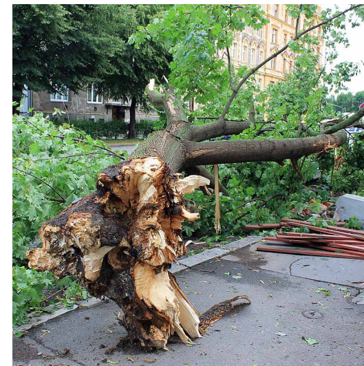
Oprava krovu kostela po vichřici, která také poničila stromy v blízkosti kostela