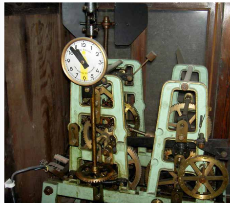
Obr. 1 – Mechanický stroj našich věžních hodin (vpravo šablonové kolo bití)

Naše věžní hodiny byly pořízeny v roce 1978 při obnově omítky kostela. Byl zakoupen kvalitní stroj od Okresního průmyslového podniku - podniku Věžní hodiny Vyškov. V té době to byl běžně vyráběný stroj splňující všechny tehdejší požadavky na věžní hodiny (oddělený pohon rafik, tepelné vyrovnávání délky kyvadla, eliminace přídavných sil na kyvadle). Současně byl přenesen z červeného kostela zvon, na nějž jej napojeno odbíjení. Protože máme pouze jeden zvon, bylo voleno kombinované bití instalací pouze jednoho bicího stroje, který zajišťuje jednak odbítí každé půlhodiny, a pak také odpočítané bití celých hodin. Dotahování hodin je zajištěno automaticky pomocí třífázového elektromotoru.