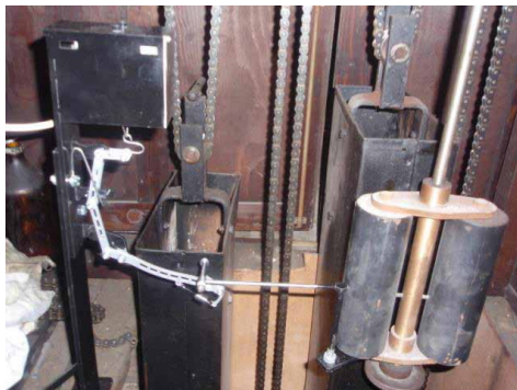
Obr. 3 – Kyvadlo je zastaveno

slední synchronizace předcházely o 10 až 15 vteřin. Na kyvadle mechanických hodin je instalováno zařízení na automatické zastavení a spouštění kyvadla pomocí ozubu. Jakmile do řídicích hodin dojde ve 4 hodiny odpoledne a v noci od spínače šablonového kola