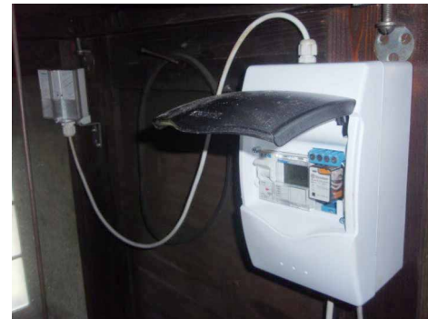
Obr. 2 – Řídící hodiny s přijímačem mnichovského signálu (vlevo)

Po prověření dobrých zkušeností s instalací synchronizačního zařízení na evangelickém kostele ve Vanovicích obrátili jsme se na firmu Petr Skála – opravy a rekonstrukce věžních hodin, Sadská o instalaci obdobného zařízení na naší věži. Toto synchronizační zařízení udržuje věžní hodiny ve stále přesném chodu tak, že je pravidelně 2x denně automaticky synchronizuje s řídicími elektronickými hodinami (v 16 hod. odpoledne a ve 4 hod. v noci). Řídící hodiny jsou prostřednictvím radiových vln napojeny na moderní evropský systém vysílaný z Mnichova.