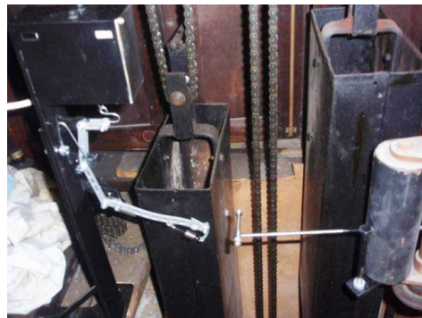
Obr. 4 – Kyvadlo je opět uvolněno

signál, řídicí hodiny dají signál k zastavení kyvadla na tuto krátkou dobu (obr. 3), řídicí hodiny odpočítají nutné zastavení (zpoždění) kyvadla a následně uvolní kyvadlo z ozubu a hodiny běžít dál.