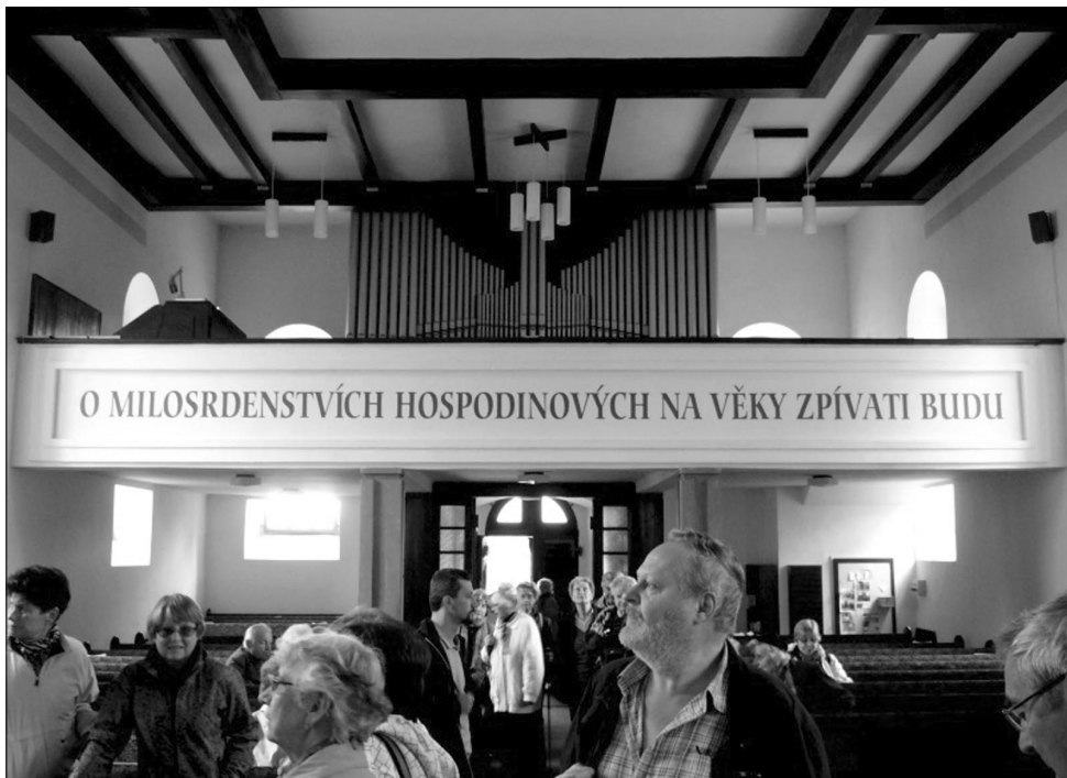
Vnitřek Horního kostela ve Vsetíně

velmi zasvěceně a také s nadsázkou vyprávěl o svém sboru a také o různých problémech, např. se salárem, který i my tak dobře známe. Měl plné ruce práce, protože právě v těchto dnech tu zasedal synod, který poprvé ve své historii zavítal na Moravu. Upřímně se z toho radoval a cítil se velice poctěn. I my máme radost, že pro synod nejsou jenom Čechy, ale že do společenství církve patří i Morava. Po modlitbě a požehnání jsme se s váženým a milým br. farářem rozloučili. Promiňte mi, ale pro mne osobně silný zážitek. Moc děkuji!