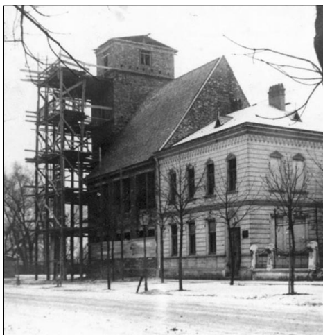
Zakonzervovaná starba kostela v roce 1919

Přístavba kostela s věží měla zcela jiný osud. Na přípravu stavby byl dostatek času, vedly se dlouhé diskuse o architektonickém řešení, počátku vel-