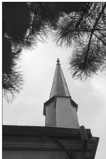
Věž drahanovického kostelíka