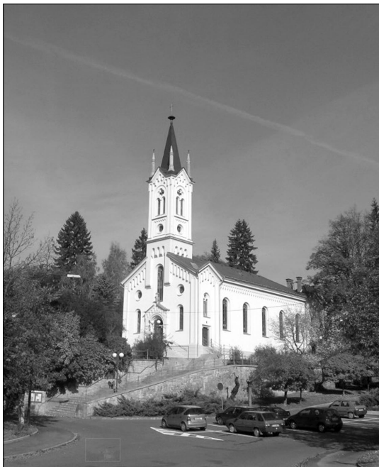
Kostel Dolního sboru na Vsetíně

Synod bude zahájen slavnostními bohoslužbami ve čtvrtek 29. května večer na svátek Nanebevstoupení Páně v kostele Dolního sboru a bude pokračovat ustavením synodu v kostele Horního sboru. Páteční a sobotní jednání proběhne v Kulturním domě na Vsetíně. Na sobotu večer bude setkání synodálů a ekumenických hostů v kostele a na zahradě Dolního sboru za účasti veřejnosti.