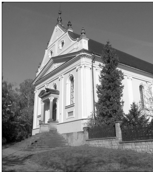
Kostel Horního sboru na Vsetíně

V neděli 1. června se rozjedou synodálové do více jak dvaceti okolních sborů, aby zde vykonali bohoslužby a informovali o průběhu a závěrech jednání synodu. Každý sbor v okolí navštíví skupinka 3–4 poslanců z jednoho seniorátu. Oficiální ukončení synodu bude při nedělních bohoslužbách v kostele Horního sboru.